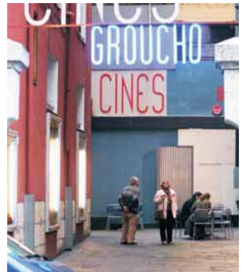
Exterior de los cines de la calle Cisneros.

Los cines Groucho de Santander recibieron en 2007 a un total de 31.588 espectadores, un 10,3 por ciento más que el año anterior, en que fueron 28.625. Un incremento que, según la dirección de la empresa pone de manifiesto la ‘consolidación’ alcanzada en el tercer año de existencia de las salas. Según el balance dado a conocer ayer, la asistencia a los Groucho fue ‘irregular’ a lo largo del año, siendo la época de invierno la que registró un mayor número de espectadores, que se redujo en primavera y al comienzo del verano. La media de asistencia por sesión registró también una ligera subida respecto al año anterior, pasando de 13,06 en 2006 a 14,40 en 2007, año en que se programaron en total 2.193 sesiones.