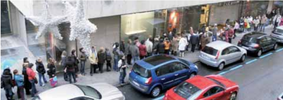
Imagen de una de las colas que se vieron ayer en el centro de Santander justo antes de que las tiendas abrieran sus puertas. CEA BENITO

El Ayuntamiento de Camargo ha abierto el plazo de solicitudes para la concesión de espacios en el Centro Municipal de Empresas de Trascueto. Los locales se concederán por un plazo de doce meses.