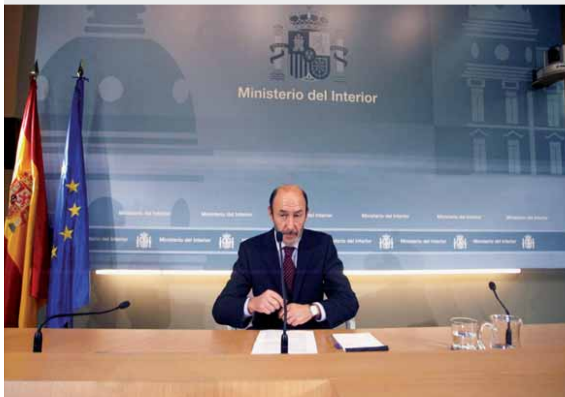
El ministro del Interior, Alfredo Pérez Rubalcaba, comparecía ayer ante los medios para dar explicaciones sobre el ingreso en el Hospital Donostia del presunto etarra detenido el domingo, Igor Portu. Según el responsable de la cartera de Interior, las lesiones que sufren el presunto etarra son fruto del uso de la fuerza reglamentaria que tuvo que emplear la Guardia Civil, que cumplió "escrupulosamente" la legislación.