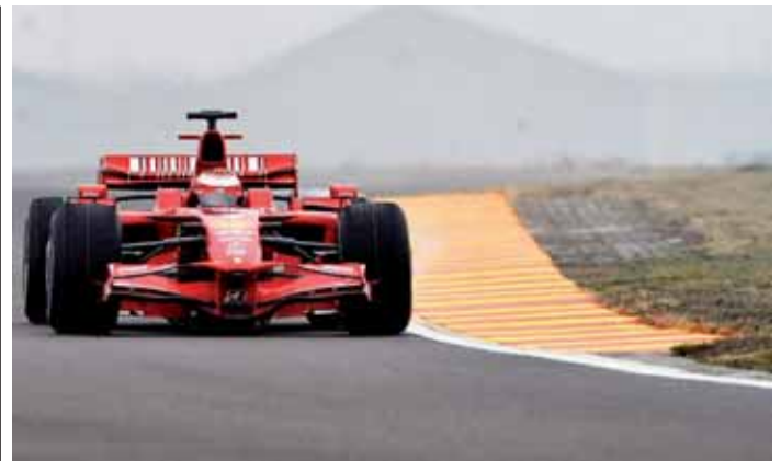
El piloto finlandés durante las primeras vueltas del Ferrari 2008, en el circuito de Fiorano.

La cara de la moneda le tocó a José Manuel Calderón después de ver como sus Raptors de Toronto tuvieron todos los elementos a su favor para conseguir la victoria, pero al final no pudieron superar las genialidades del alero LeBron James (93-90).