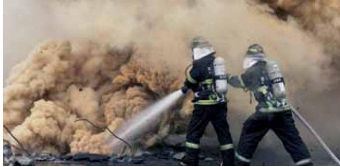
Dos bomberos tratan de luchar contra el fuego que se levantó en el almacén coreano.

Al parecer, en el momento en el que se declaró el incendio 56 trabajadores se encontraban dentro del edificio, algunos de los cuales fueron rescatados o lograron escapar. Unos 500 bomberos y policías participaron en las tareas de rescate.