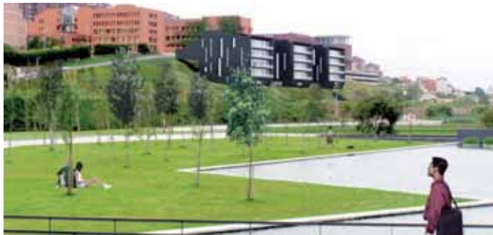
Infografía de la futura Casa del Estudiante en los terrenos de la Universidad.

La UC prevé que la Casa del Estudiante albergue los vicerrectorados de Estudiantes y de