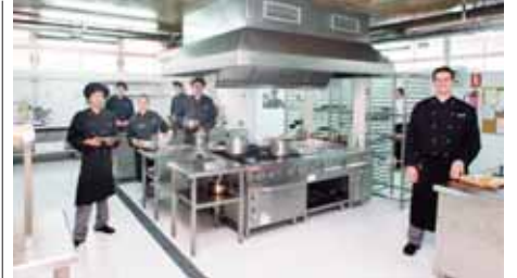
Así es la cocina de este centro de formación y restaurante. ER

área de descanso y juegos, comedor, salas de ordenadores y estudios, biblioteca y aulas de trabajo en equipo, y entre los edificios se equiparán dos estanques con zonas verdes.