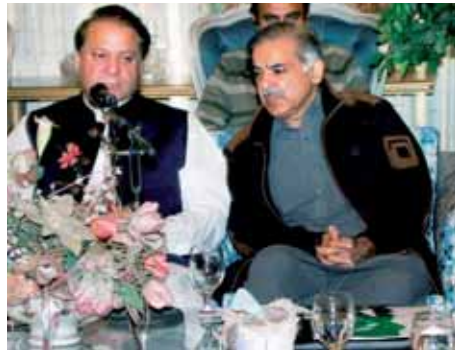
Sharif, a la izquierda, durante una comparecencia.

En declaraciones posteriores a la reunión, Sharif reclamó la constitución de una Comisión Electoral "independiente", tras cuestionar la neutralidad del actual Gobierno interino, al que calificó de "continuación del régi-