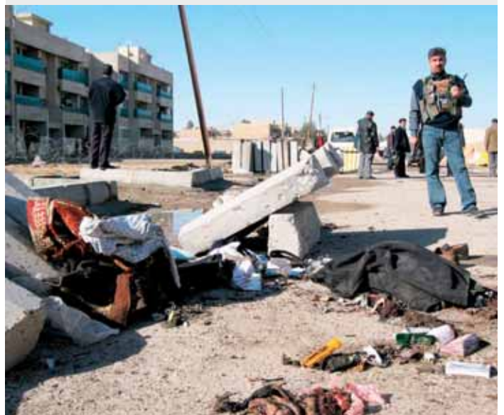
Un miembro del movimiento Al Sahwa, fotografiado en el lugar donde ayer se registró un atentado suicida al norte de Bagdad. Al menos catorce personas han muerto y 26 más están heridas tras un doble ataque suicida contra el Diwan Waqf Suni, una institución suní gubernamental en Azamiya.