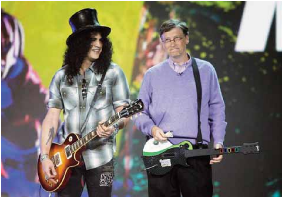
Bill Gates junto al ex guitarrista de Guns n' Roses, Slash, durante la celebración de la Feria de la Electrónica de Consumo de Las Vegas.